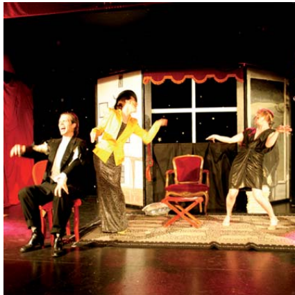
Spectacle du Studio 3 en 2008 "The Cabaret de quat' sous" d'après Jean Tardieu

Le cursus Théâtre et Cinéma prépare le futur acteur professionnel au travail sur scène et devant la caméra. Les cours de jeu de l'acteur dispensent les techniques et méthodes, enseignées à Acting International, sont la base opérante des constructions et articulations pédagogiques significatives du cursus. Cet enseignement dure trois ans. Il se caractérise par une diversité concertée d'approches des codes de jeu, autant que par son efficacité avérée sur une longueur de temps. Il est assuré par des maîtres de classe internationale, qui sont tous des artistes en activité.