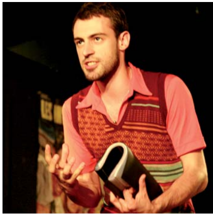
Spectacle du Studio 2 en 2009 "Children's hour" d'après Lillian Hellman.

Le cursus Théâtre et Cinéma prépare le futur acteur professionnel au travail sur scène et devant la caméra. Les cours de jeu de l'acteur dispensant les techniques et méthodes, enseignées à Acting International, sont la base opérante des constructions et articulations pédagogiques significatives du cursus. Cet enseignement dure trois ans. Il se caractérise par une diversité concertée d'approches des codes de jeu, autant que par son efficacité avérée sur une longueur de temps. Il est assuré par des maîtres de classe internationale, qui sont tous des artistes en activité.