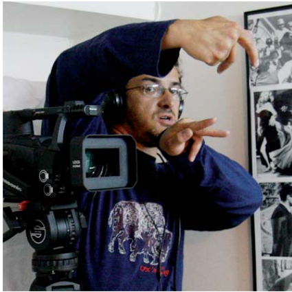
Tournage de fin d'année du Studio 1.

Le cursus cinéma prépare le futur acteur professionnel au jeu face caméra, au cinéma et à la télévision. Les cours de jeu de l'acteur dispensant les techniques et les méthodes, enseignées à Acting International, sont la base opérante de la construction pédagogique du cursus. Cet enseignement dure trois ans. Il se caractérise par une diversité concertée d'approches des codes de jeu, autant que par son efficacité avérée sur une longueur de temps. Il est assuré par des maîtres de classe internationale, qui sont tous des artistes en activité.